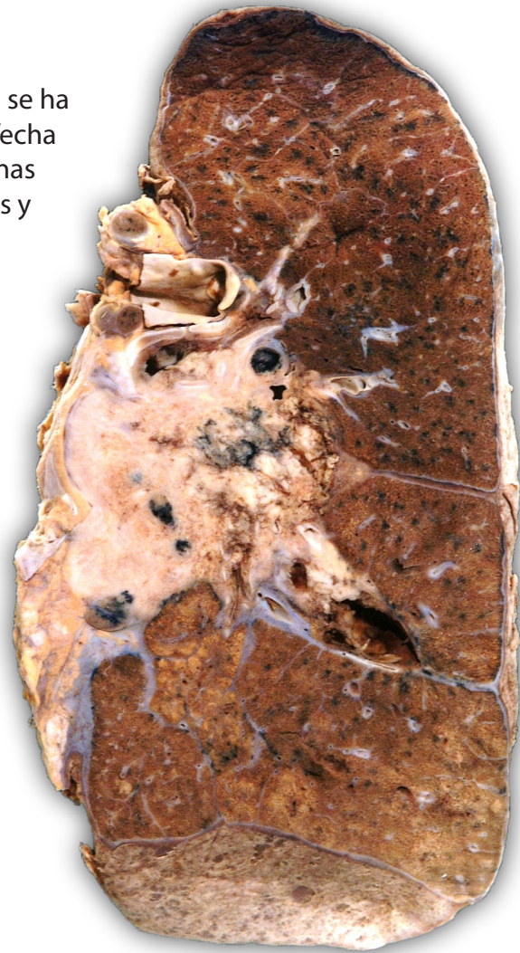
Imagen: Corte transversal de un tumor pulmonar que ha impedido la respiración y ha causado la muerte. Las áreas marrones circundantes muestran cómo sería un pulmón normal, mientras que el área de color crema muestra el tamaño del tumor en el pulmón.

¡Siga intentándolo! Lo más importante es estar determinado y ser persistente.